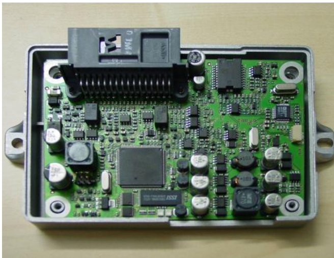
Abb. 2: Freisprecheinrichtung für LKW